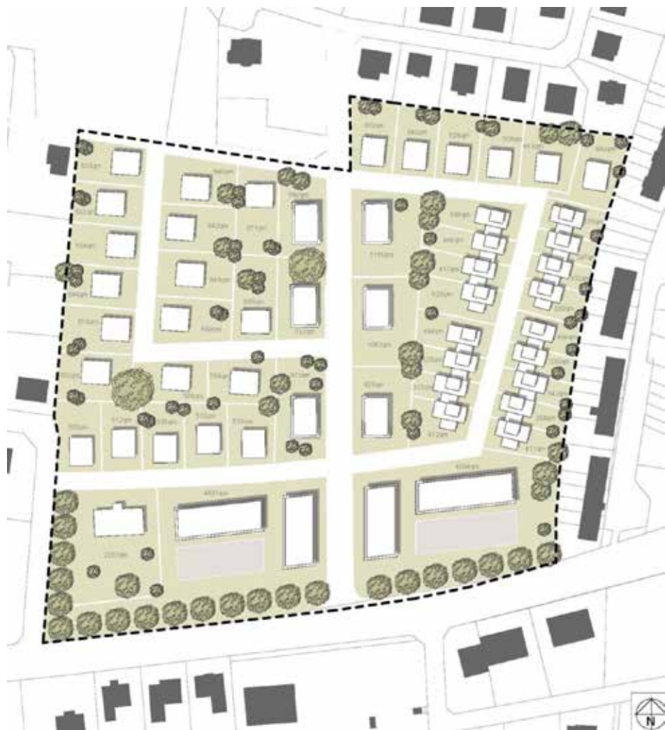
Variante 3 Konzepterstellung ibt

Auf dem früheren Krankenhaus Gelände entsteht ein tolles, buntes, modernes Baugebiet. Kettenhäuser, Reihenhäuser, Mehrfamilienhäuser, aber auch Bungalows können hier gebaut werden. Die Auslegung erfolgt im Zeitraum vom 10.12.2019 bis 13.01.2020. Auch ökologische Aspekte werden berücksichtigt: u. a. Blockheizkraftwerk, Zisternen um die Ableitung des Regewassers zu reduzieren, Flachdächer ab 45 qm müssen begrünt werden, je 450 qm Grundstücksfläche muss ein heimischer Laubbaum oder ein hochstämmiger Obstbaum gepflanzt werden.